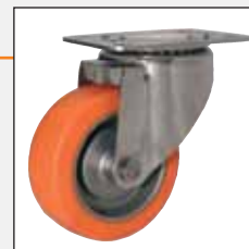
Anneliese-Rolle Anneliese wheel

As a standard feature all our heat-resistant wheels do have a four screw fastening thus offering a balanced weight transmission and long-life durability. Depending on the floor type we recommend wheels with different degrees of hardness.