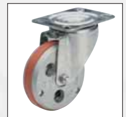
Romanelli-Rolle Romanelli wheel