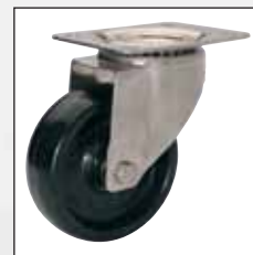
Hartkunststoff-Rolle Hard plastics wheel