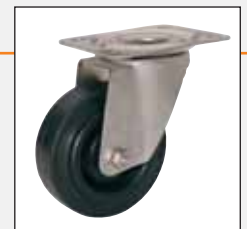
Hotline-Rolle Hotline wheel